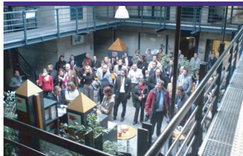
La manifestation a accueilli 150 personnes. Les deux-tiers provenaient de l'extérieur du canton.