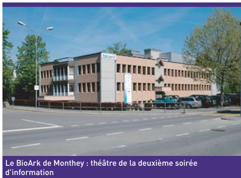
Le BioArk de Monthey : théâtre de la deuxième soirée d'information

Sous ce titre, la fondation the Ark a organisé, pour les entreprises, deux soirées d'information sur les différents programmes de recherche régionaux, nationaux et européens. Les manifestations du 26 avril à Viège et du 18 mai à Monthey se sont déroulées en partenariat avec Euresearch (Berne) et la HEVs.