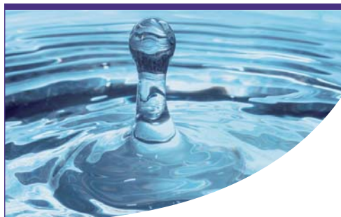
Voici, en exclusivité, le visuel principal de BlueArk.

L'eau (accumulation, fil de l'eau, eau potable, eaux usées) est le point de départ de toutes les considérations relatives aux énergies renouvelables. Les autres éléments, comme la biomasse, le soleil, le vent et la géothermie, ou les combinaisons de ceux-ci, sont traités ultérieurement. En matière d'efficacité énergétique, le domaine du bâtiment et de la récupération de chaleur figurent au premier plan.