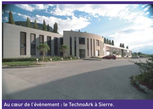
Au cœur de l'évènement : le TechnoArk à Sierre.

L'IDIAP (Institut Dalle Molle d'Intelligence Artificielle Perceptive) de Martigny a mis à disposition une technologie innovante permettant de coupler les images vidéo tournées pendant les ateliers par Canal 9, avec les présentations PowerPoint des orateurs (cf. rubrique "IdeArk" au verso). Retrouvez ces images sur www.technoark.ch !