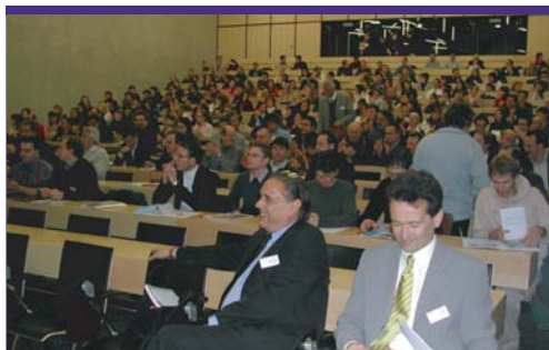
175 personnes étaient réunies lors de cette manifestation.

Près de 175 personnes, provenant de toute la Suisse romande, se sont ensuite déplacées au TechnoArk pour suivre les 6 ateliers animés par les entreprises transformeuses et les instituts de recherche du TechnoArk. Ces ateliers ont permis aux participants de comprendre comment les facteurs de « l'économie directe » peuvent être repris avec succès dans des modèles d'affaires innovants.